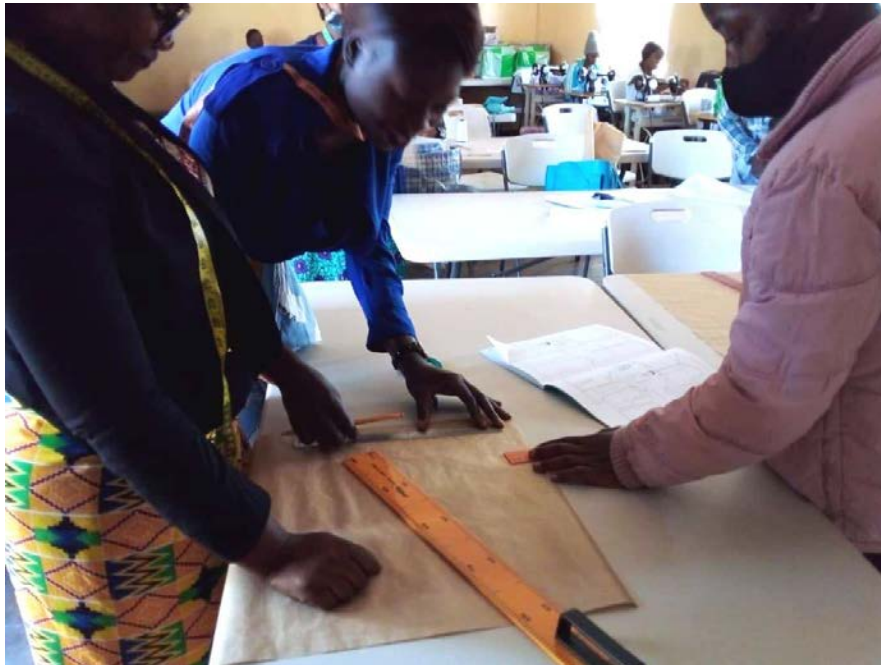
Bilder vom Projekt:

Den Mitgliedern des Ausschusses Ortskirche-Weltkirche war sehr schnell klar, mit diesem Geld wollen wir etwas Besonderes, etwas Neues auf den Weg bringen. Ein neues Projekt, das Nachhaltig durch Ausbildung wirkt und das im Sinne der Aktion Hoffnung das Thema „Kleidung“ beinhaltet.